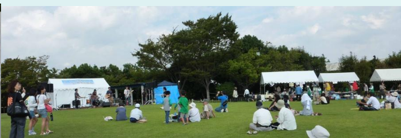
シーサイドコンサート in 鳴尾浜臨海