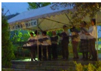
(点灯式での聖歌隊)